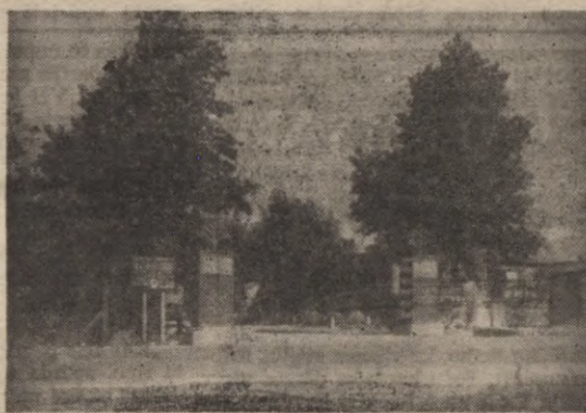
„Straumēnu” nometnes galveno ieejas vārti

Tā viņi dzīvo, šie vietuļnieki, šie klusie varoņi. Tie negrib, ka par viņiem raksta vai runā. Kas ir patiess viņu draugs, lai atbrauc pats un visu apskata viņi saka. — Ikviens te ir mīļš un gaidīts viesis, un tiks uzņemts ar īsti latvisku viesmīlību. Gu — gs