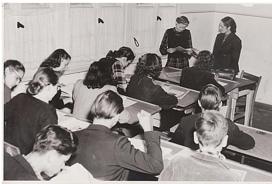
ALG saime 1950.g.