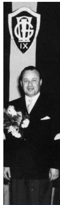
Londonas Avīze 06.06.1958