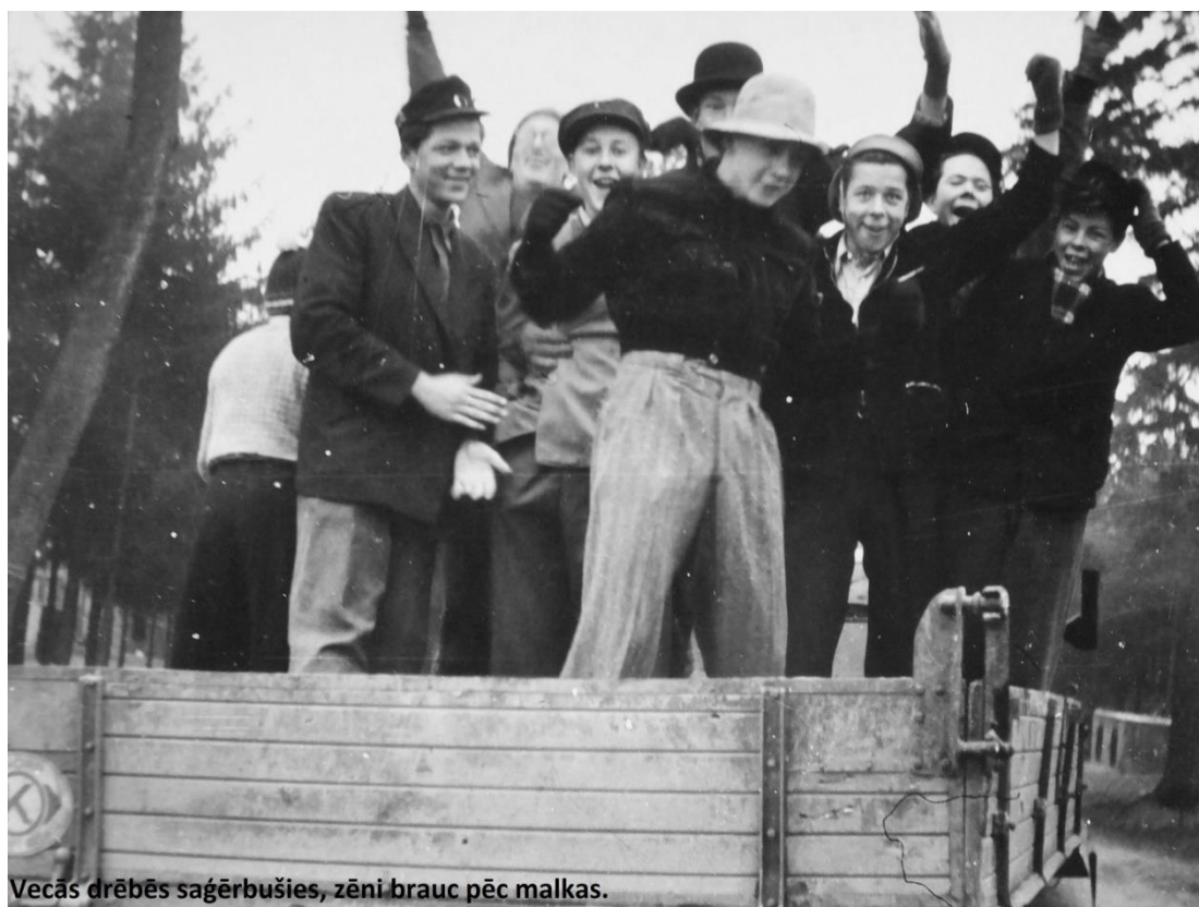
Vecās drēbēs saģērbušies, zēni brauc pēc malkas.