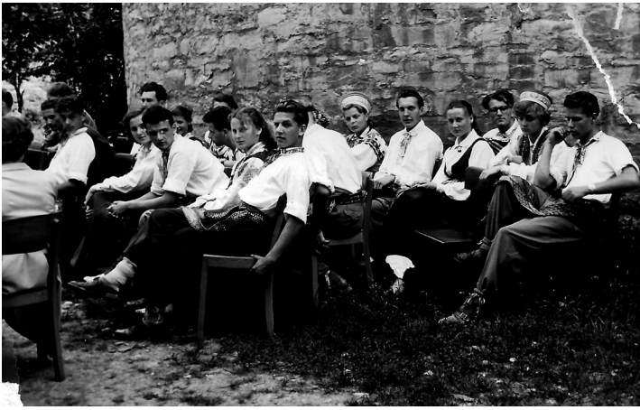
Tautas deju grupa atpūtā pirms uzstāšanās.

km attālās Bīlefeldas. Tikām dejujuši vairākās vietās Vācijā, un man liekas, ka reizi pat bijām Francijā.