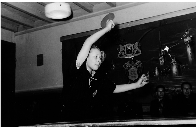
Galda teniss — Daumants

bet neatceros gan, ka būtu viņu uzvarējis. Pēc vajadzības ģimnazijai bija arī sava