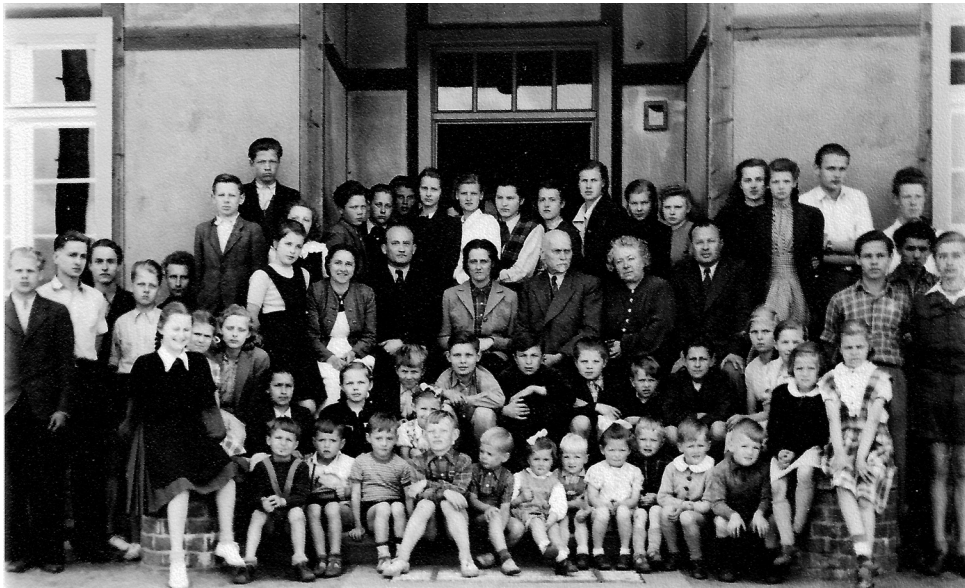
Skolas saime Augustdorfas vecās skolas priekšā, 1951. gadā.

par labu ko šodien penzijas gados esmu atcerējies un spējis uzrakstīt.