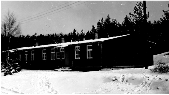
Augustdorfas skolas baraciņa.

telpas nometnes pārvaldes, DV, un citu organizāciju vajadzībām. Tur rakstāmmašīna klabēja cauru dienu un pat nakti, neviens jau neskaitīja nostrādātās stundas.