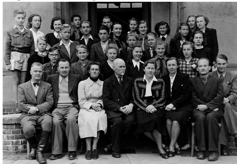
Skolas saime Augustdorfas vecās skolas priekšā, laikiem 1951. gadā, varbūt 1952.

Augustdorfā 1951. gadā, lieluliela istautiešu vairums jau bija izklīdis izceļošanas vilņos