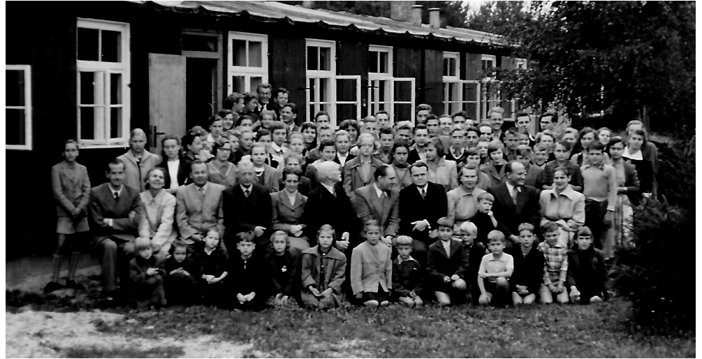
Augustdorfas skolas saime skolas priekšā, ap 1954/5. gadu.

skolas baraciņa bija atkal citā pusē, bija tādu gabaliņu ko staigāt. Tai laikā nometnē jau automašīnas neredzēja, visa pārvietošanās bija vai nu kājām vai ar divriteni. Tāpat telefonu tikpat kā nepazinu un neatceros ka to