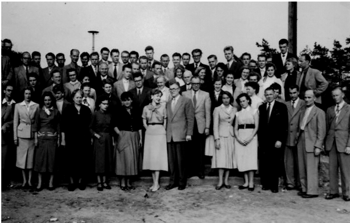
ELJA kongresa Augustdorfā dalībnieku kopbilde.