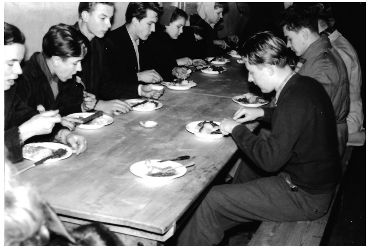
Internāta audzēkņi pusdienās.