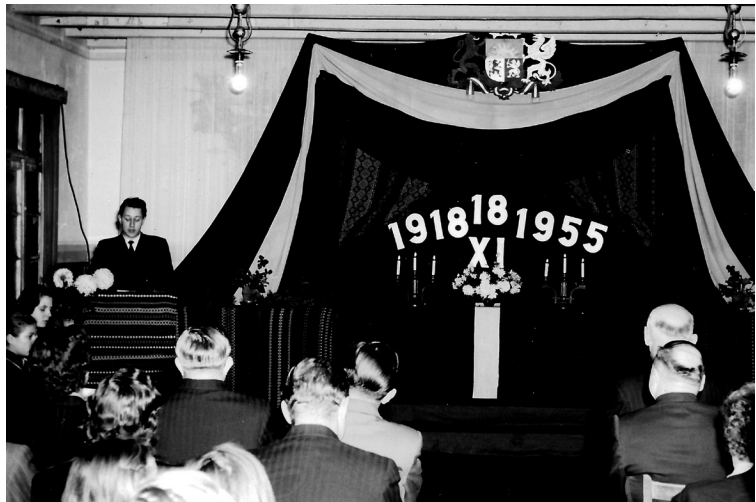
Mana pirmā publiskā uzstāšanās ar 18. nov. runu.

Varbūt te varētu pieminēt tādu skaistu un interesantu gadījumu. Proti, Detmoldā bija