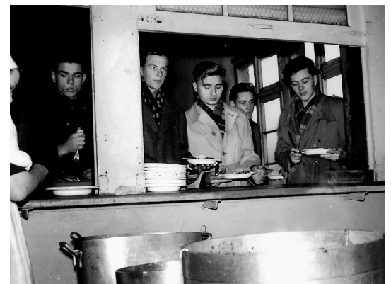
Internāta audzēkņi pusdienās.

Mums deju repertuārs bija plašs. Reizi sākām saskaitīt cik bagāts tas ir, un