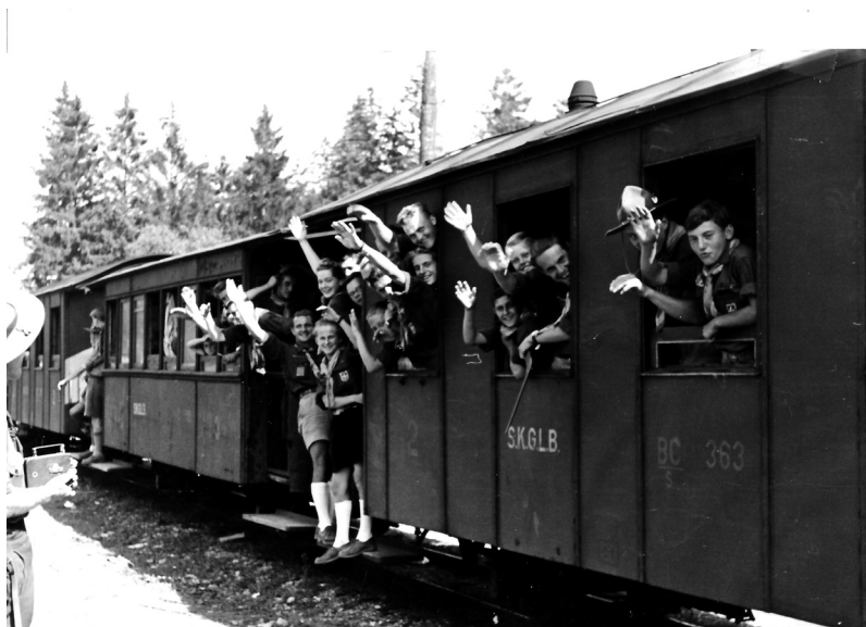
Skauti ceļā uz džamboreju Austrijā.

“skautot”. Šis piedzīvojums jau uz mums visiem atstāja paliekošu iespaidu, kaut ko tādu var piedzīvot tikai vienreiz mūžā.