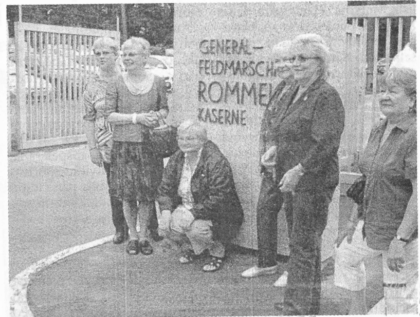
Pie Augustdorfas kazarmu vārtiem

Un nu uz nometni paŗu – pie vārtiem liela zīme: ROMMEL KASERNE. Tur mūs sagaida